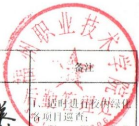
福州职业技术学院绿化工作监督检查表 (2019年4月第三周)