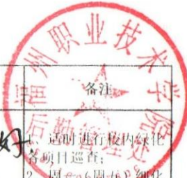
福州职业技术学院绿化工作监督检查表 (2019 年 4 月 第 9 周)