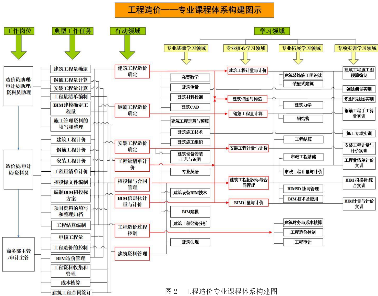
图2 工程造价专业课程体系构建图